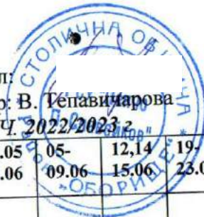
ГРАФИК на 10 Б клас ЗА ПРОВЕЖДАНЕ НА КЛАСНИ И КОНТРОЛНИ РАБОТИ ЗА II УЧ. СРОК НА УЧ. 2022/2023 г.