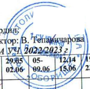
ГРАФИК на 10 А клас ЗА ПРОВЕЖДАНЕ НА КЛАСНИ И КОНТРОЛНИ РАБОТИ ЗА I УЧ. СРОК НА УЧ. 2022/2023 г.